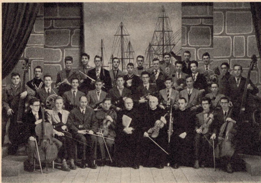
Das Studentenorchester 1956